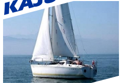
Sportina 680 Jeanneau Tonic 23 Hunter 23.5 Sunway 21

Auf unseren beiden Stationen am Kleinen und am Großen Brombachsee stehen über 30 Segelboote für Sie bereit, die alle TÜV-geprüft und vom Landratsamt zugelassen sind. Auf den Kajütbooten Hunter, Jeanneau Tonic und Sportina kann auch übernachtet werden. Eine genaue Beschreibung der einzelnen Bootstypen finden Sie auf unserer Homepage.