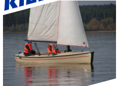
Polyvalk, Flying Cruiser